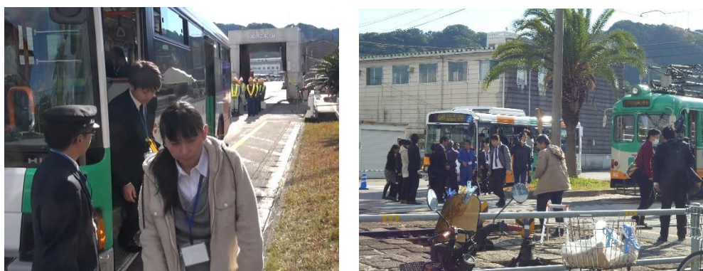
津波避難訓練風景